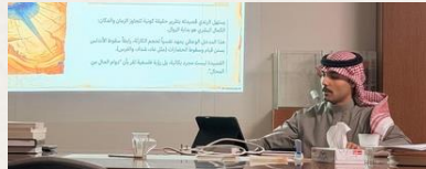
عرض الشريحة: قانون الختمية التاريخية ومريثة الرندي